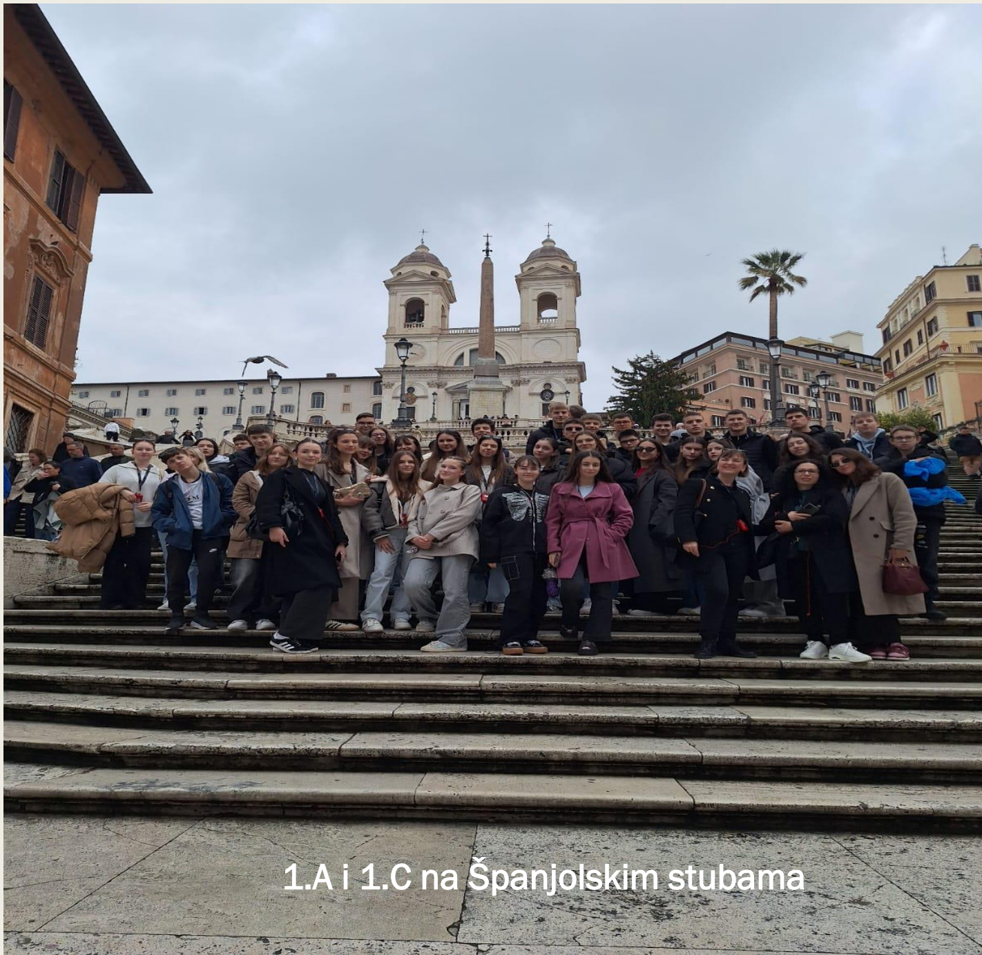
1.A i 1.C na Španjolskim stubama