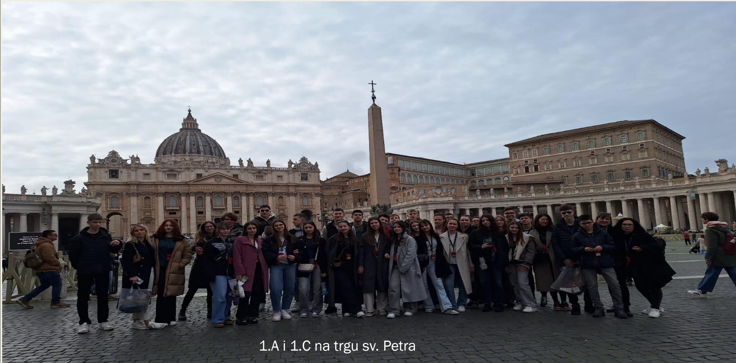
1.A i 1.C na trgu sv. Petra