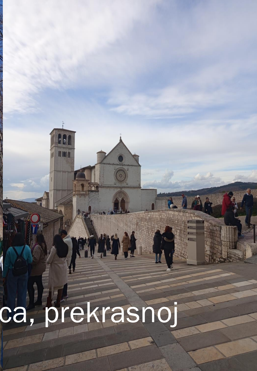
Asiz – uživanje u cvrkutu ptica, prekrasnoj prirodi i nevjeoatnom miru