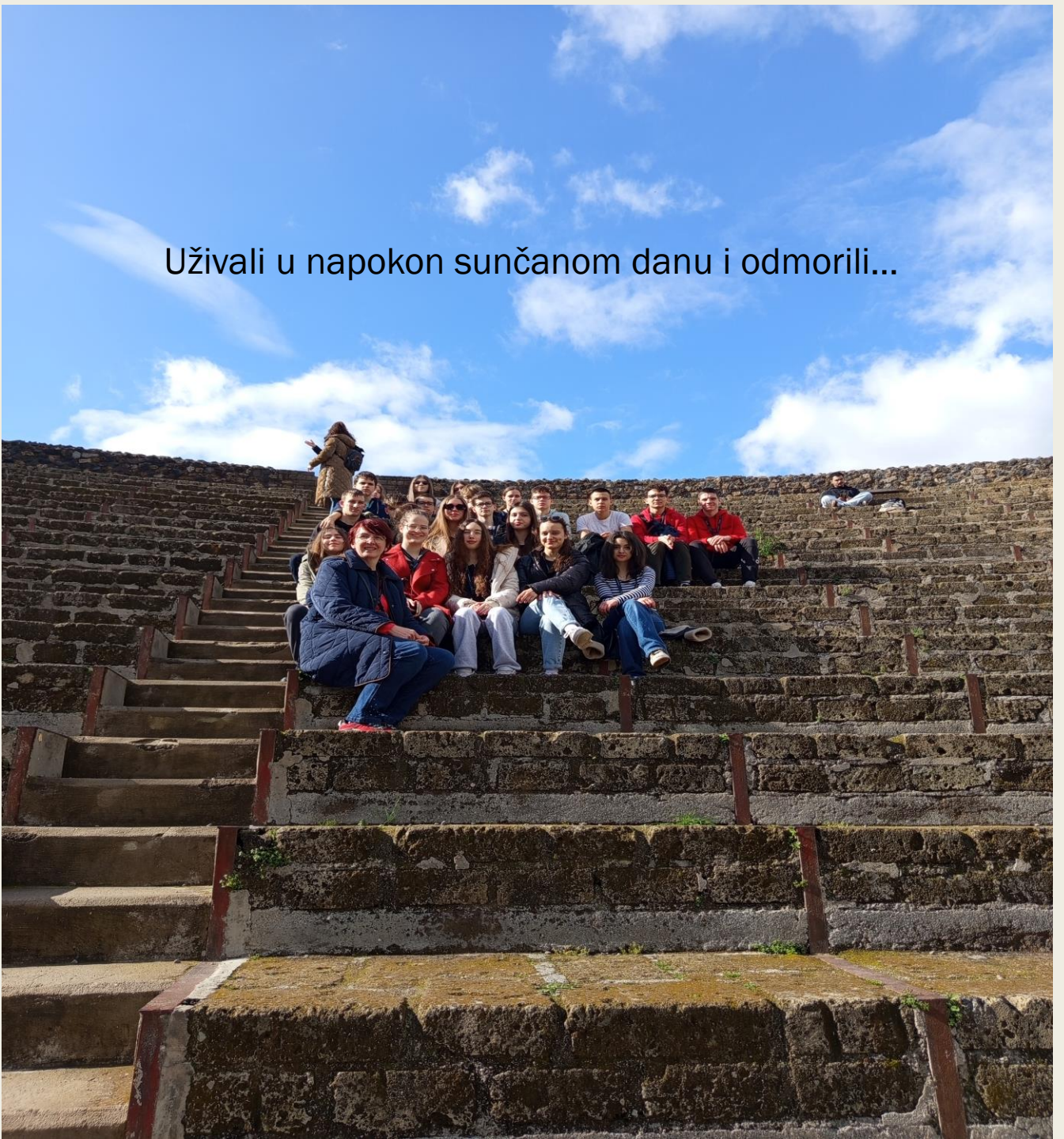
Uživali u napokon sunčanom danu i odmorili...