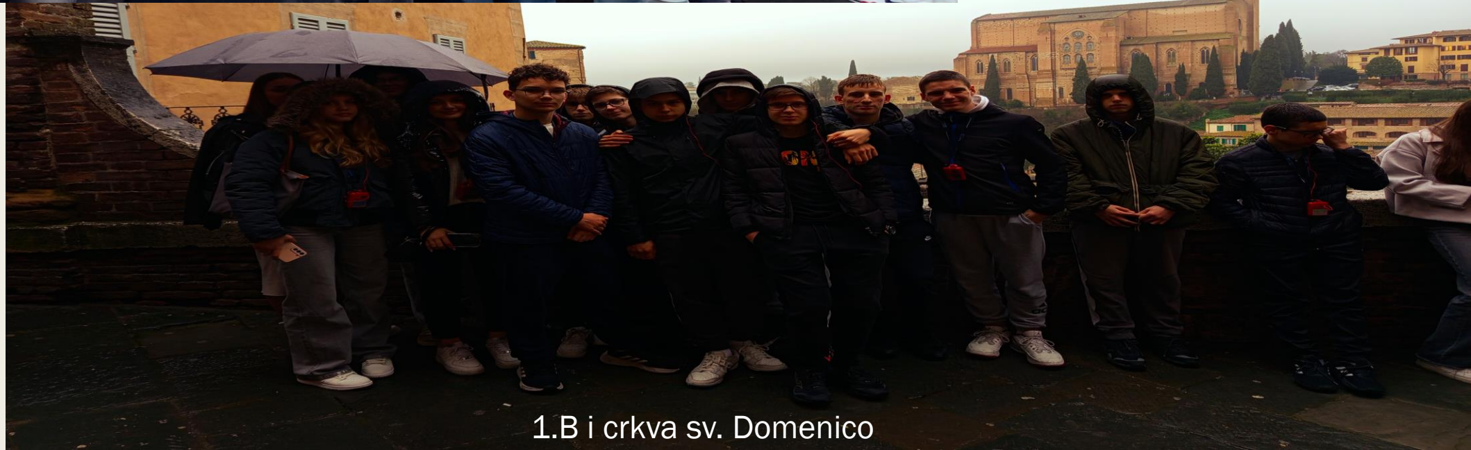
1.B i crkva sv. Domenico