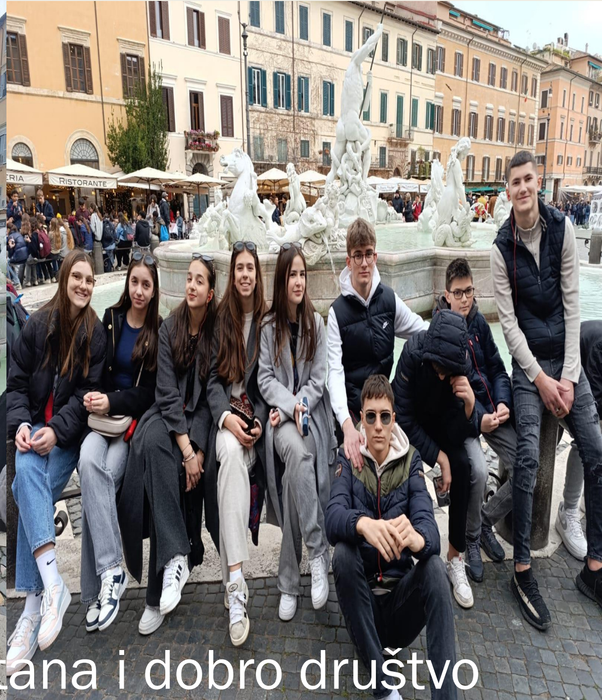
Pantheon, Neptunova fontana i dobro društvo