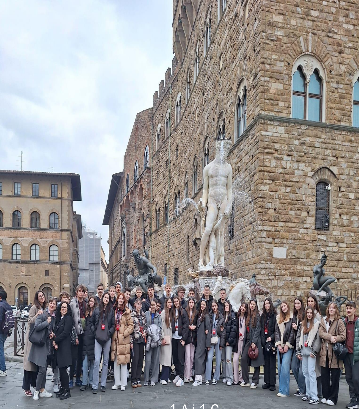
1.A i 1.C