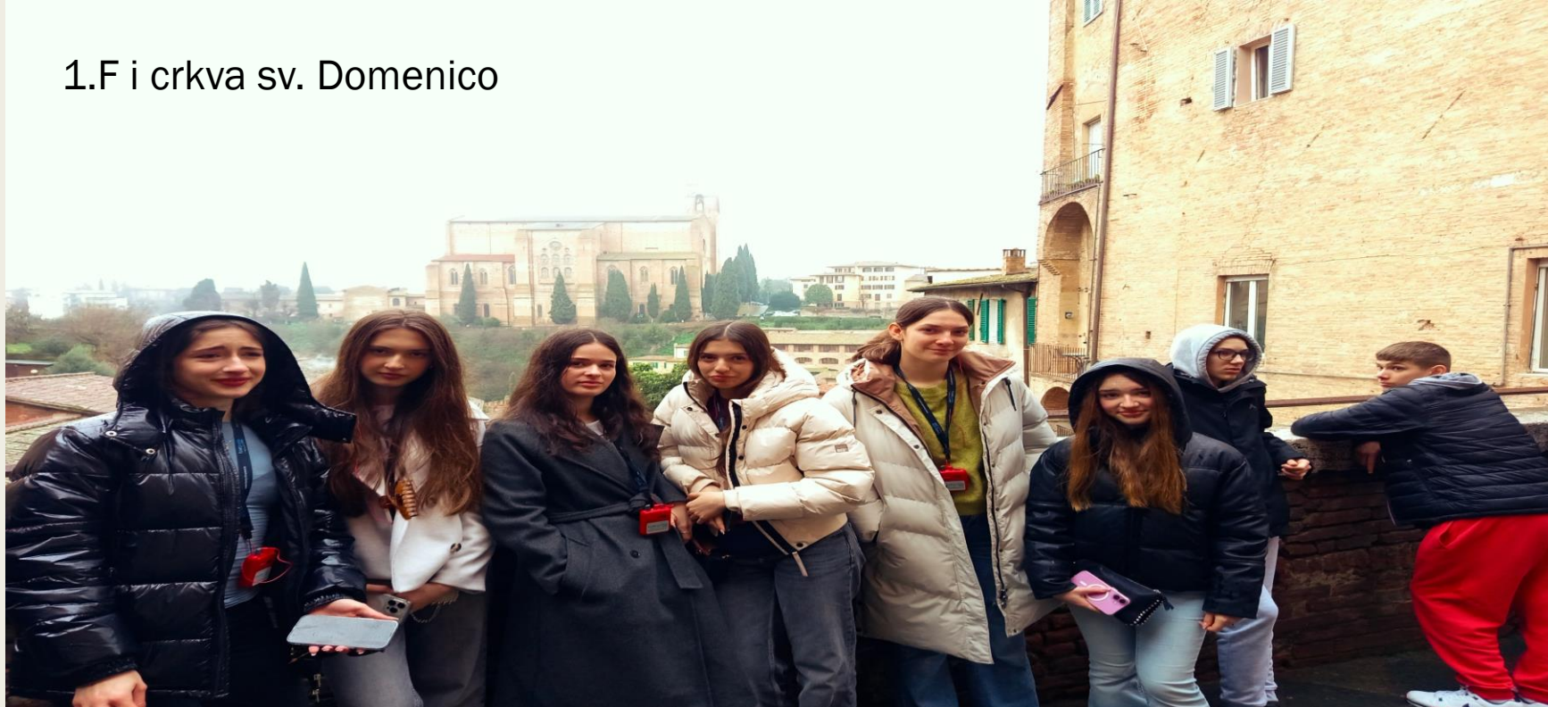
1.F i crkva sv. Domenico