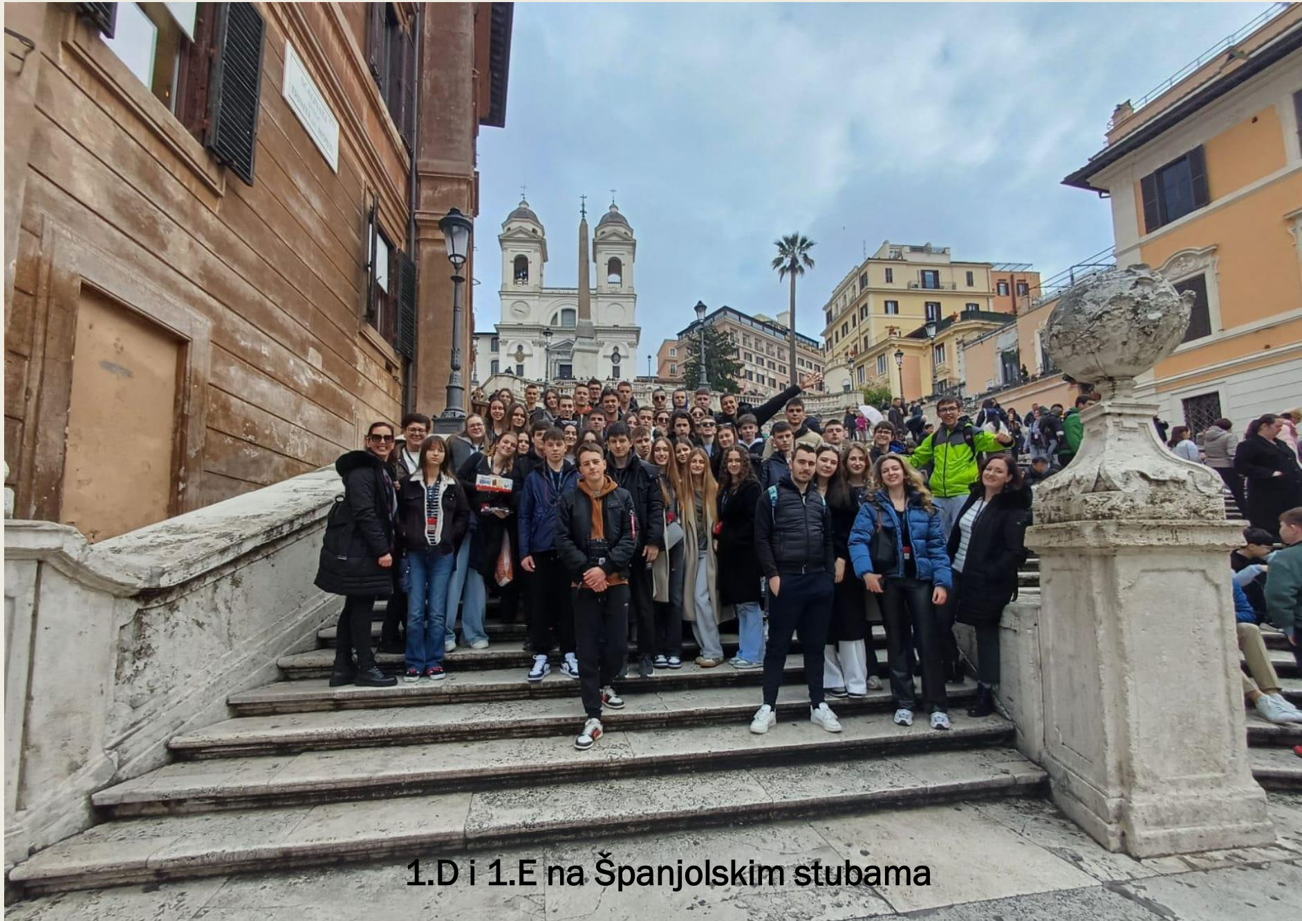
1.D i 1.E na Španjolskim stubama