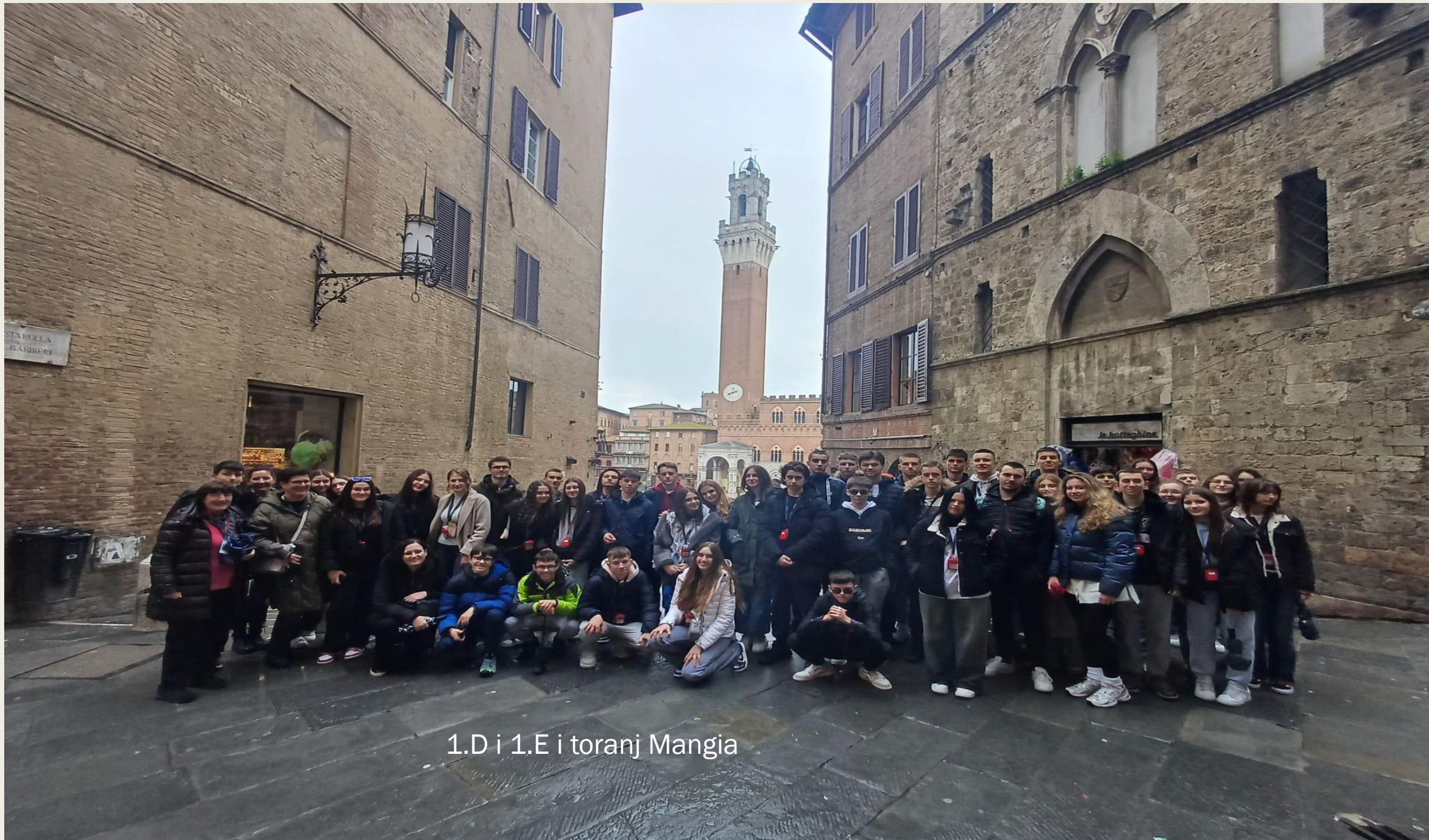
1.D i 1.E i toranj Mangia