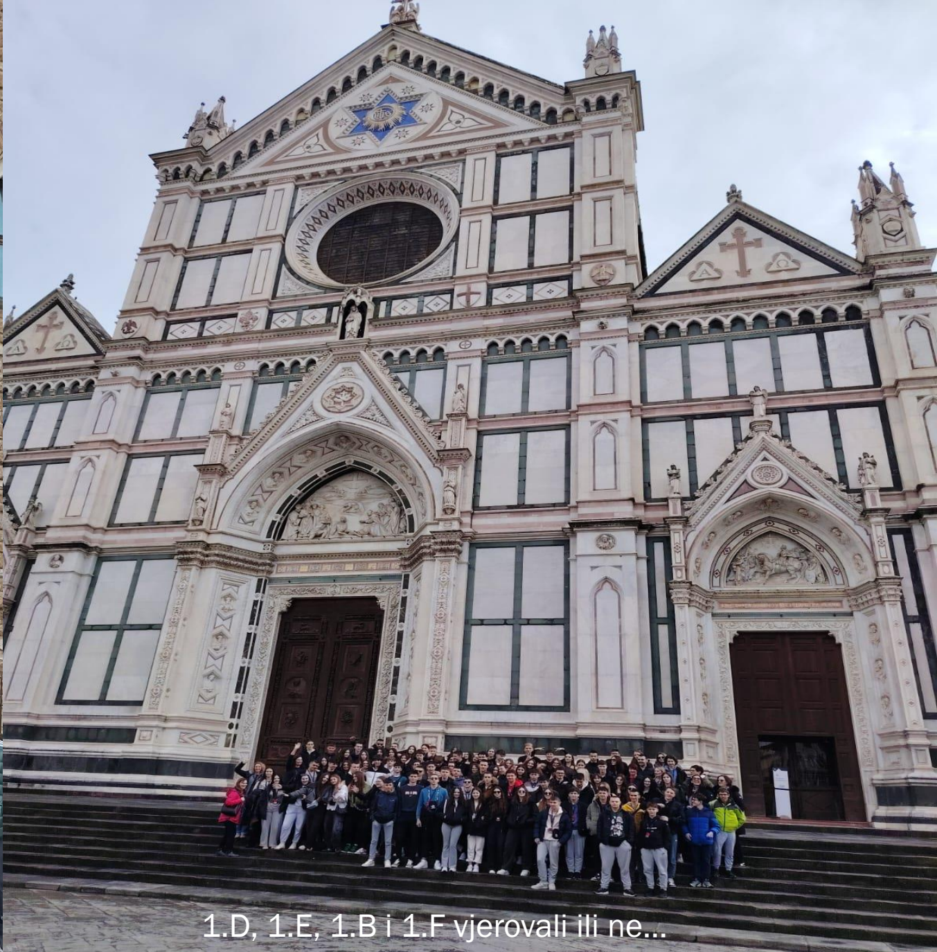
1.D, 1.E, 1.B i 1.F vjerovali ili ne...