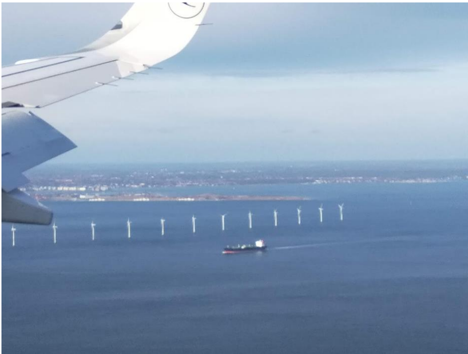
- Pogled na Kopenhagen iz aviona