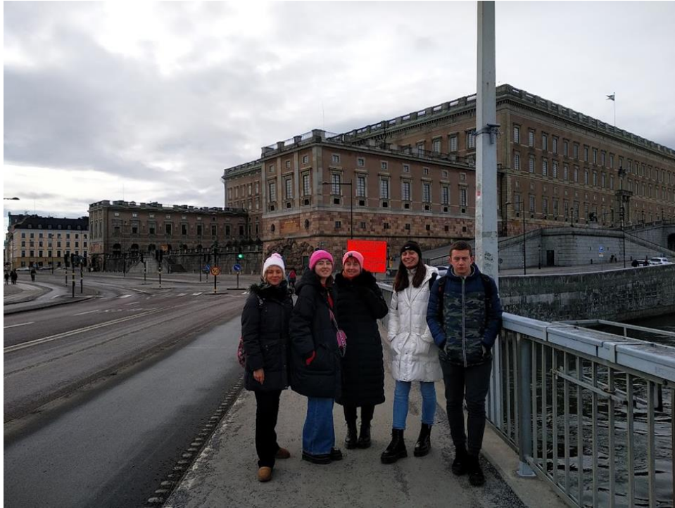
- Kraljevska palača