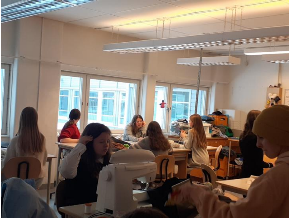
- Učionica za šivanje