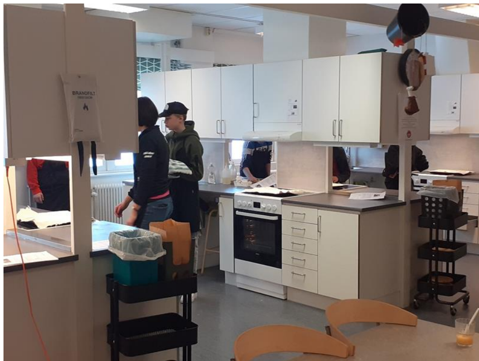
- Razgledavanje škole, učionica za kuhanje