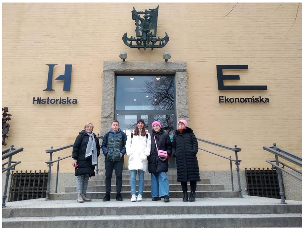
- Historijski muzej