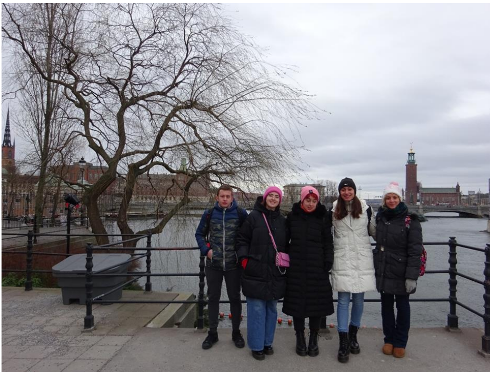
- Šetnja po Stockholmu