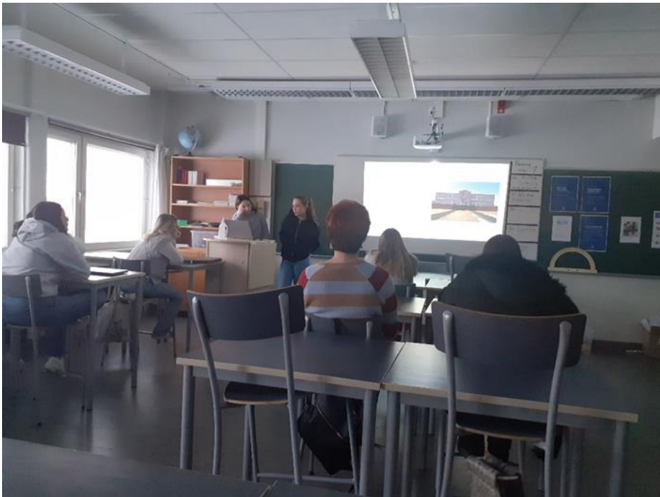
- Predstavljanje obrazovnih sistema