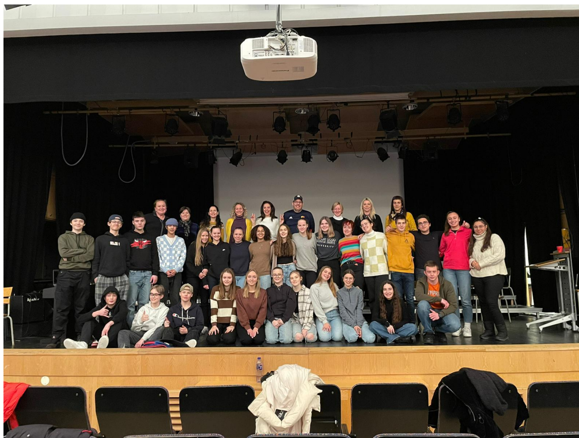
Svi učenici i profesori koji sudjeluju u projektu