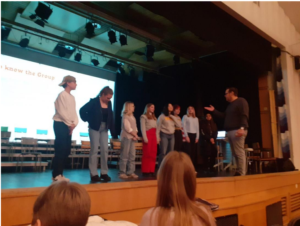
- Grupne aktivnosti za upoznavanje