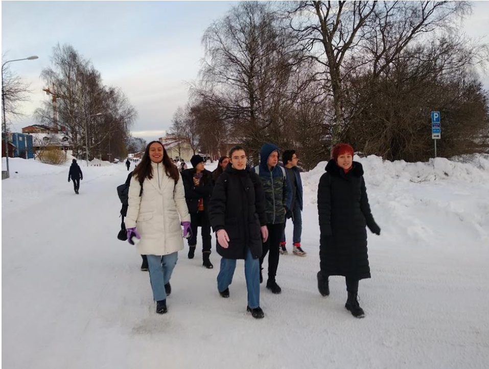
- Dolazak u školu