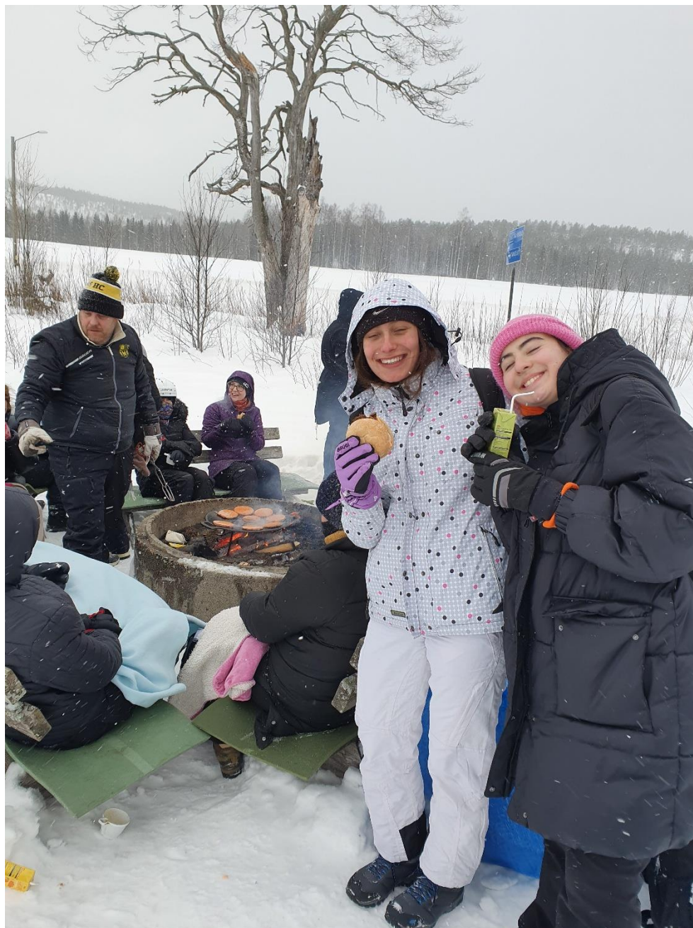
-švedski profesor priprema burgere za ručak, ostali se griju oko vatre