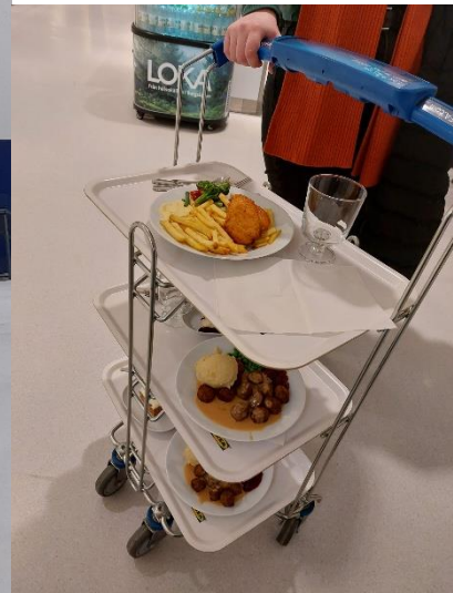
- Posjet trgovačkom centru i večera u Ikea