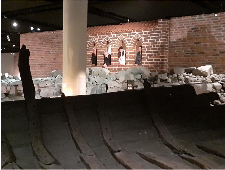
- Srednjovjekovni muzej