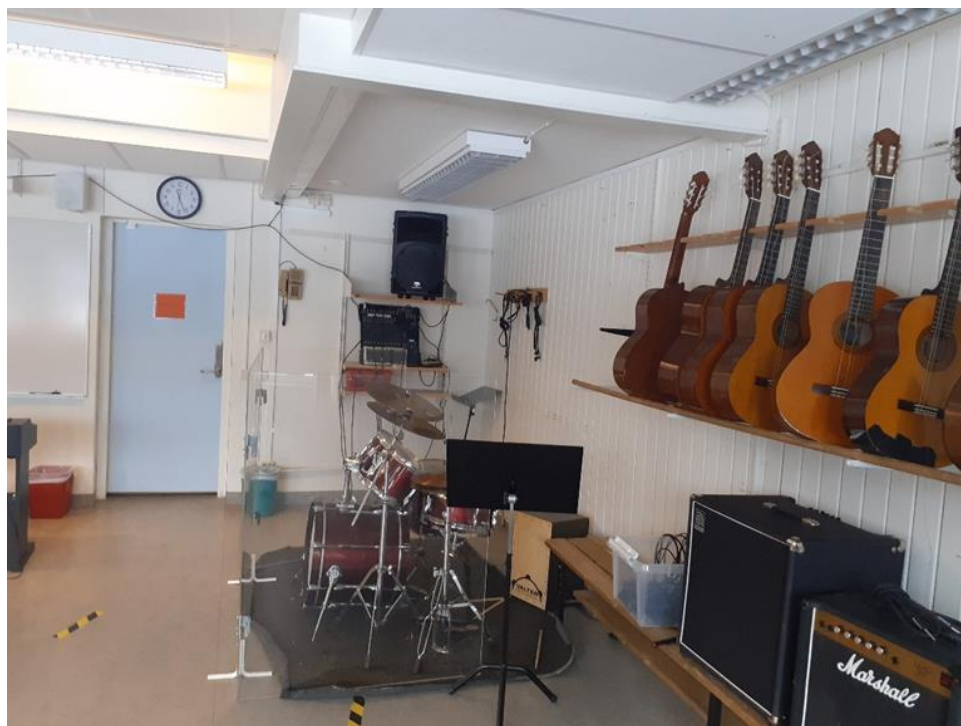
- Učionica glazbenog