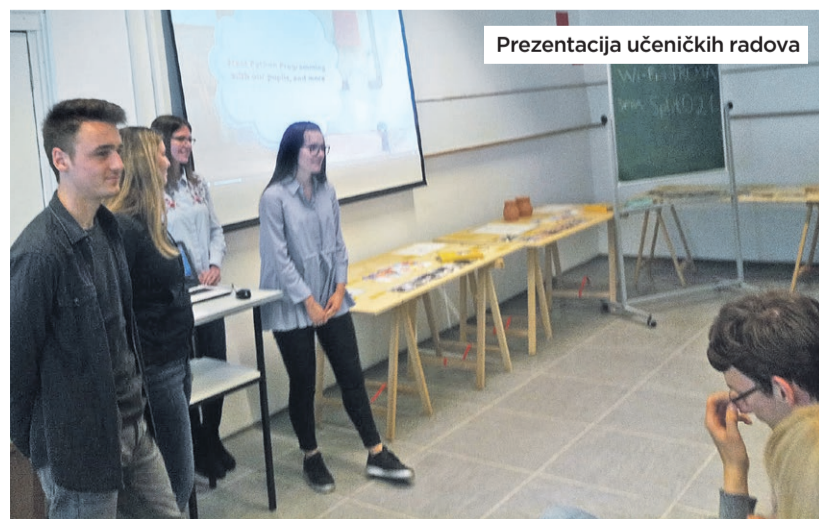
Prezentacija učeničkih radova

Raznolikost tema i prilagodba projekta, zadataka i aktivnosti tijekom projekta najveće su prednosti eTwinninga, što smo nastojali osvijestiti kod naših sudionika i time ih potaknuti na sudjelovanje.