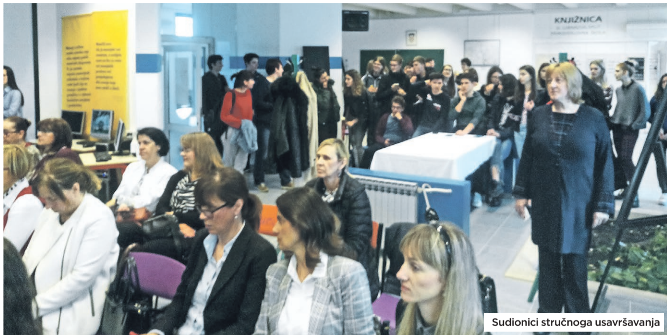
Sudionici stručnoga usavršavanja

BROJNE SE MOGUĆNOSTI NUDE NASTAVNICIMA KROZ ETWINNINGOVU ZAJEDNICU ŠKOLA DILJEM EUROPE